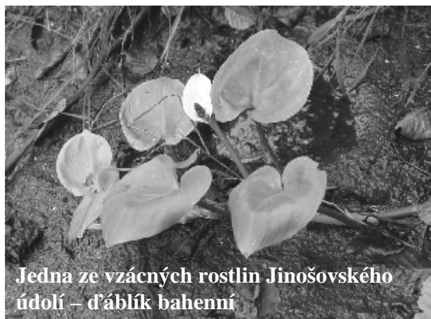
Jedna ze vzácných rostlin Jinošovského údolí – d'áblík bahenní

Jinošovské údolí leží nedaleko Vlašimi. Na potoku Orlina se zde nachází soustava pěti rybníků, obklopených vlhkými loukami. Malebné údolí bývalo oblíbeným vycházkovým místem obyvatel Vlašimi, zajímavé je i z přírodovědného hlediska. Roste zde řada pozoruhodných (zejména mokřadních) rostlin, jako je orchidej prstnatec májový či jedovatý bíle kvetoucí d'áblík bahenní, součástí břehových porostů je nepříliš běžná olše šedá, rybníky a přilehlé křoviny jsou domovem desítek druhů ptáků. V posledních desetiletích však Jinošovské údolí ohrožoval nezáměr vlastníků luk o jakoukoli údržbu na straně jedné a příliš