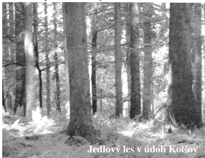
Jedlový les v údolí Kolšov

vycházkové cesty s alejemi původních druhů dřevin a lavičkami zvoucími k odpočinku v příjemném prostředí.