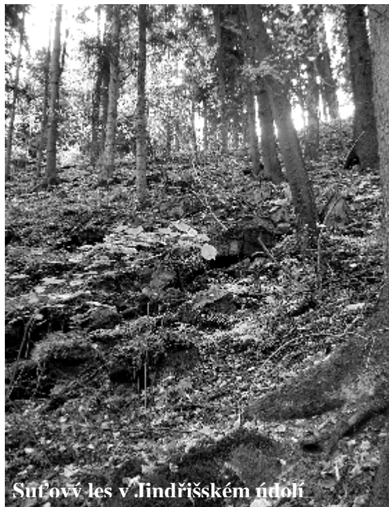
Suťový les v Jindřišském údolí

Jindřišské údolí je dalším z velkých projektů, do kterého jsme se mohli díky vaší podpoře pustit. Jde o údolí Hamerského potoka nedaleko Jindřichova Hradce. Dno údolí tvoří převážně vlhké louky, prudké skalnaté svahy jsou do značné míry porostlé suťovými lipojavorovými a jedlovými lesy (jedná se o nejzachovalejší lesní porosty v širším okolí Jindřichohradecka).