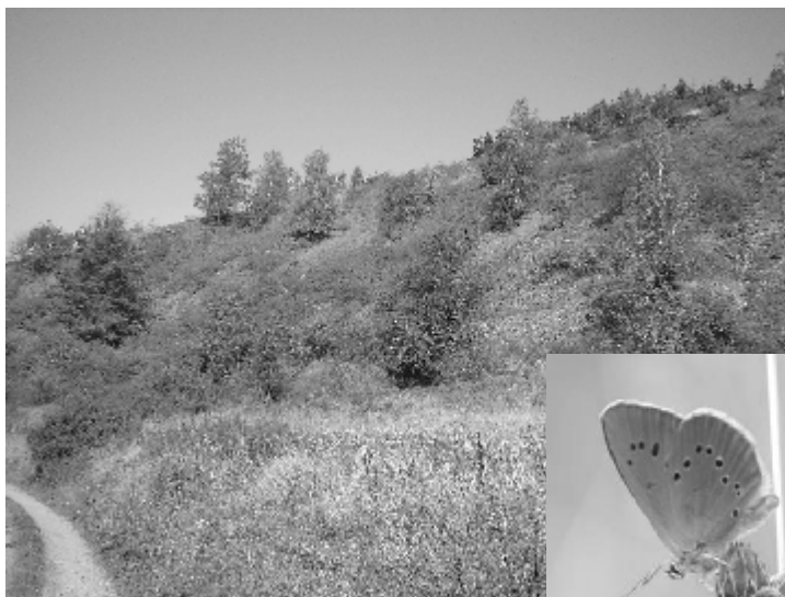
Kamenec a jeden z jeho vzácných obyvatel – modrásek bahenní

Že jde o místo nejen přírodovědně cenné, ale i velmi pěkné, se můžete přesvědčit sami, když se vydáte po zelené turistické značce z Radnic k severu. Lokalita Kamenec se nachází před stejnojmennou vesnicí vpravo od cesty, asi 2 km od Radnic.