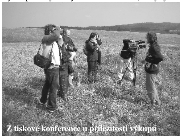
Z tiskové konference u příležitosti výkupu

Jsme velice rádi, že se nám povedlo díky Vaší podpoře v unikátně krátkém čase shromáždit potřebné množství financí a těchto 6,5 ha luk jsme mohli v rámci kampaně Místo pro přírodu vykoupit. Bylo by velkou škodou, kdyby se