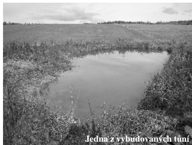
Jedna z vybudovaných tůň

pozemky vrátily k intenzivnímu zemědělskému obhospodařování, čímž by veškerá práce stovek dobrovolníků a nadšenců přišla vniveč. Vlastníkem vykoupených pozemků se stal Český svaz ochránců přírody, který nyní bude společně s pozemkovým spolkem Lunaria dále „krajinu útulnou“ rozvíjet, pro poučení příchozích i jako možnost návratu řady druhů rostlin a živočichů do míst, kde kdysi žily.