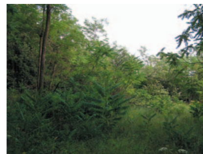
Stav pozemku před zásahem - v popředí rozrůstající se invazní druh dřeviny, pajasan žláznatý (červen 2005).

Sdružení pro venkov provádí od roku 2003 pravidelné zásahy v přírodní rezervaci Zázmoníky i mimo chráněné území. Snahou je zvětšovat plochu lučních společenstev a uvolňovat cenné druhy původních dřevin kácením akátu a pajasanu. Travobylinné enklávy jsou koseny tak, aby byl podpořen rozvoj druhově pestrých společenstev a bylo sníženo výskyt třtiny křovištní, místy i svídy krvavé. Péče je možná pouze se souhlasem vlastníků dotčených pozemků. Vlastnická struktura na Zázmoníkách je však komplikovaná. Práce jsou proto každoročně omezeny asi na 1 hektar z celkových 16 hektarů. Z hlediska úspěšného managementu je nezbytné provádět práce opakovaně a zároveň rozšiřovat obhospodařovanou plochu. Od roku 2005 proto Sdružení pro venkov založilo Pozemkový spolek Zázmoníky a zahájilo jednání s vlastníky a výkup pozemků, který podporuje Český svaz ochránců přírody v rámci kampaně Místo pro přírodu. Vykoupené pozemky jsou majetkem Českého svazu ochránců přírody a jejich plocha se postupně rozšiřuje.