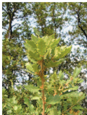
dub pýřitý, šípák ( Quercus pubescens )