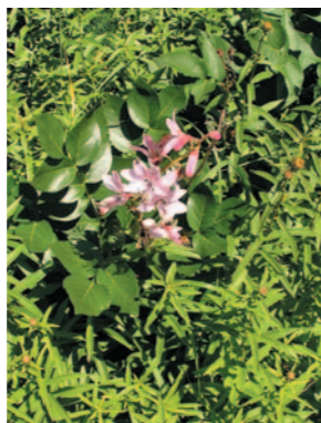
třemdava bílá ( Dictamnus albus )