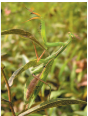
kudlanka nábožná ( Mantis religiosa )