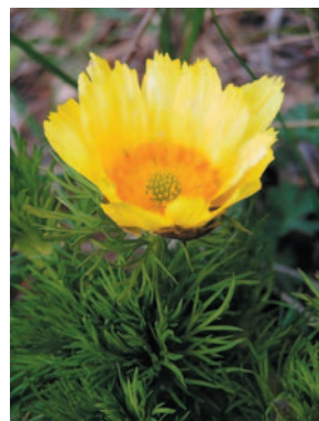
hlaváček jarní ( Adonis vernalis )

Část lokality je součástí Přírodní rezervace Zázmoníky, celé území je zařazeno do navržené lokality Kuntínov evropské soustavy NATURA 2000. Významná část plochy je pokryta porosty nepůvodních druhů dřevin trnovníku akátu a pajasanu žláznatého. Tyto dřeviny spolu s třtinou křovištní představují největší ohrožení cenné lokality.