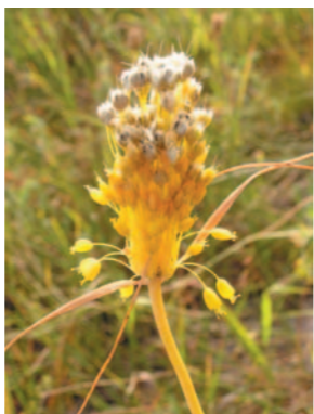
česnek žlutý ( Allium flavum )