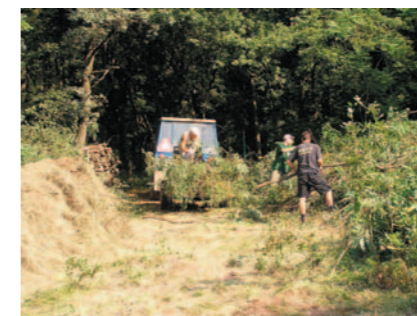
Provádění likvidace invazních dřevin a kosení v téže lokalitě (září 2005).