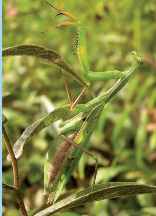
Kudlanka nábožná – populární a přesto téměř neznámá