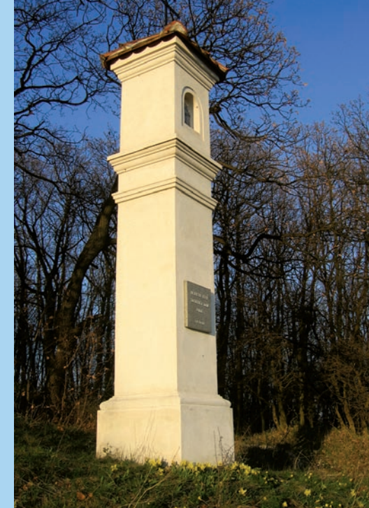
Boží muka z roku 2000