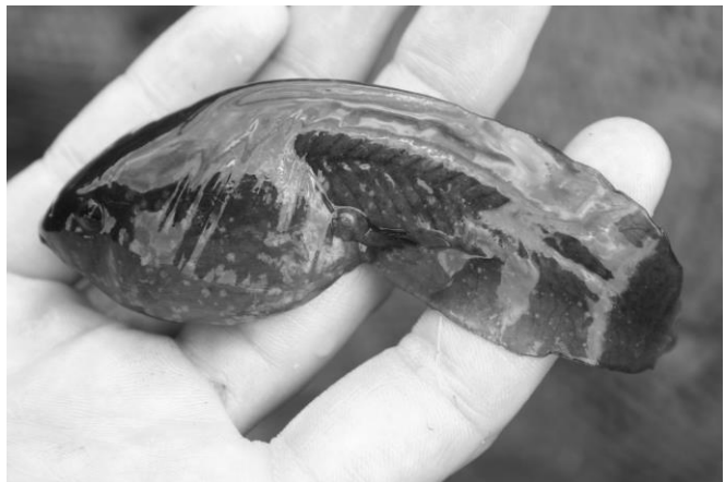
Blatnice skvrnitá a její pulec

Pozemky patřily státu a na jaře letošního roku byly nabídnuty do veřejné soutěže. Bylo nasnadě, že obnovení intenzivního hospodaření by s velkou pravděpodobností znamenalo pro zdejší populace obojživelníků zkázu. Proto jsme se rozhodli se do veřejné soutěže přihlásit a pokusit se rybníčky získat do vlastnictví. Podařilo se!