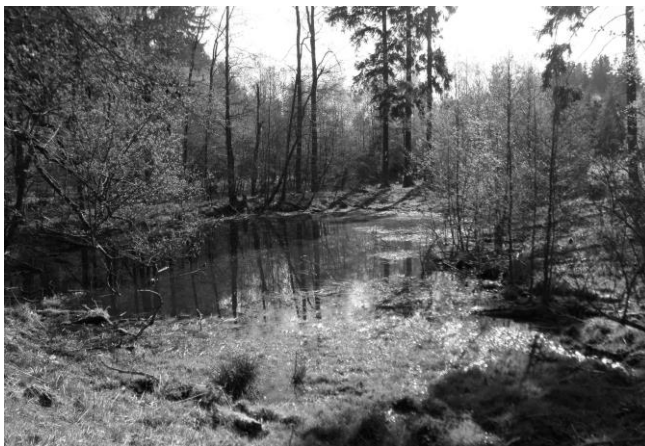
Rybníčky U kapličky