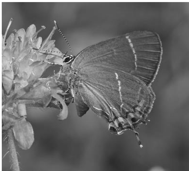
Ostruháček jilmový

Do seznamu zajímavějších druhů motýlů, vyskytujících se v Ještěřčím ráji, letos přibyl ostruháček jilmový, hnědý motýl s nápadnou ostruhou na zadních křídlech, která mu dala jméno. A po šesti letech se podařilo potvrdit výskyt vřetenušky čičorkové. Což potěší dvojnásob, protože stavy vřetenušek šly obecně v posledních letech - snad z důvodu příliš teplých zim, nikdo přesně neví – ve středních polohách hodně dolů.