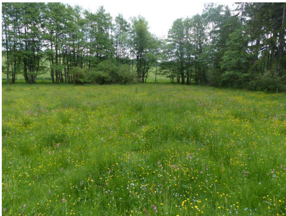
louka U Kuchyňky