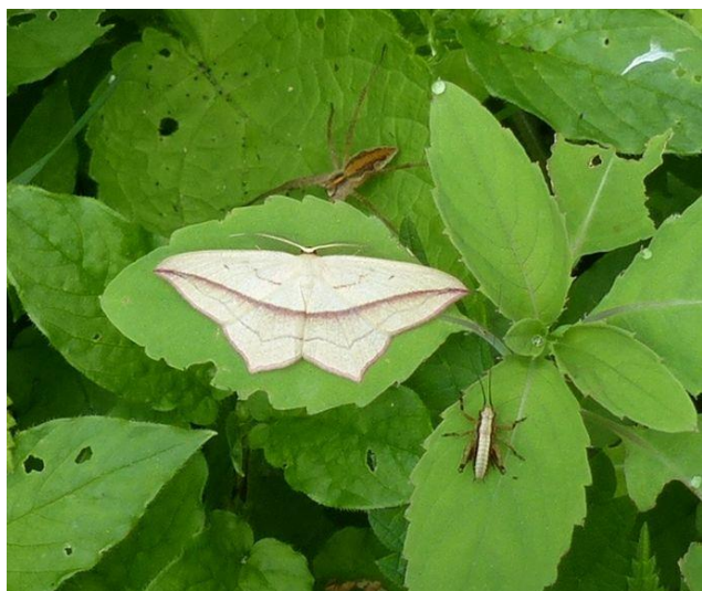
žlutokřídlec šťovíkový a spol...