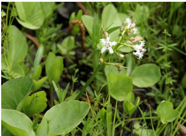
Vachta na Ospělově vykvétá málokdy ... ale někdy se podaří

Další v nedávné době realizovaný výkup byl v Ospělově na Prostějovsku. Ospělovský mokřad je lokalita malinká, celý má ani ne půl hektaru. I zde však beze zbytku platí totéž, co bylo napsáno na předchozí stránce – pro správné fungování krajiny je potřeba, aby byla co nejrozmanitější. A pokud jde o mokřad, je důležitost takových plošek dvojnásobná. O významu mokřadů pro vodní režim bylo v letošním extrémně suchém létu již napsáno mnohé. A to, že právě na mokřady je vázána řada zajímavých druhů, je známý fakt.