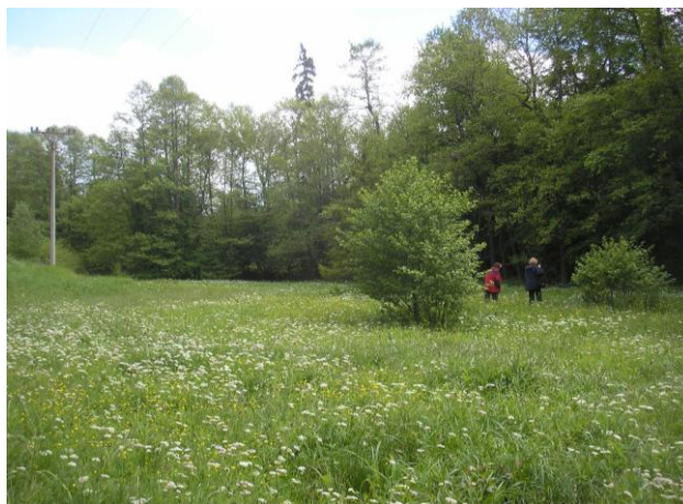
Celkový pohled na mokřadní louku u Ospělova

O Ospělovský mokřad se ČSOP stará na základě dohod s vlastníky od roku 2002. O pět let později byl vykoupen první pozemek o výměře 1167 m 2 . Současným výkupem se plocha vlastněná Českým svazem ochránců přírody zdvojnásobila.