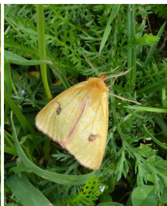
Pár záběrů z květnové návštěvy na lokalitě – žlutokřídlec šťovíkový a spol., babočka sítkovaná, přástevník chrastavcový