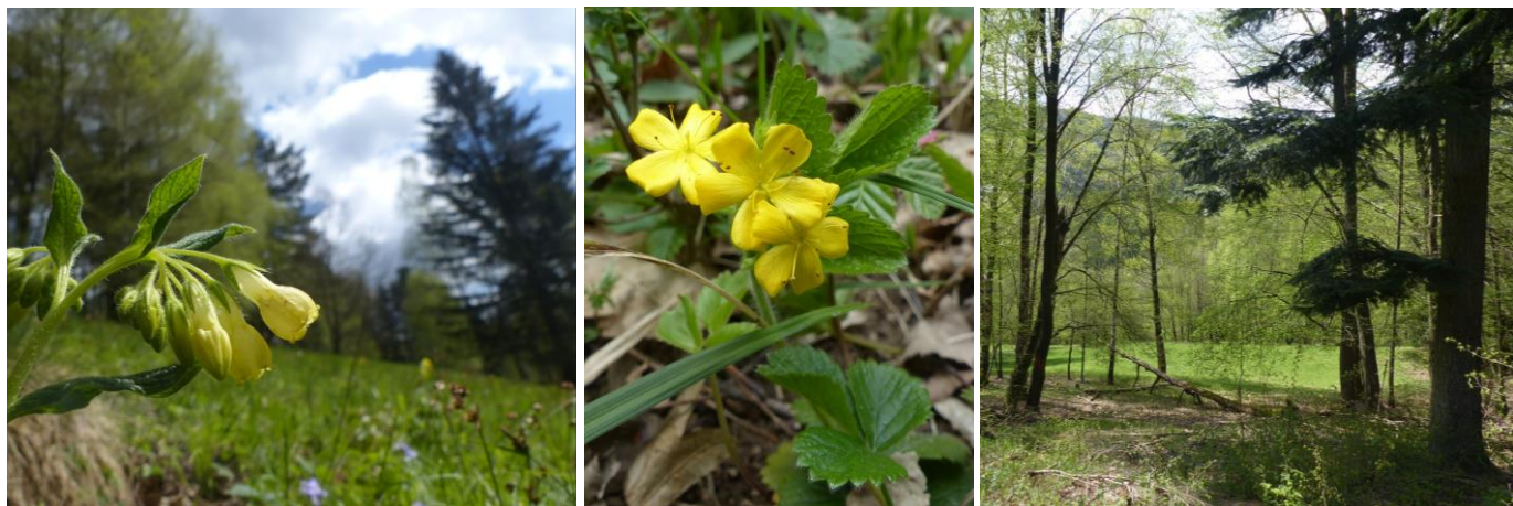
Bílé potoky – Čadovo: na první fotce v popředí kostival hlíznatý, na druhé fotce silně ohrožený řepíček řepíkovitý.

Chcete-li poznat Bílé potoky na „vlastní kůži“, můžete dorazit začátkem července, kdy (mimo jiné) zde každoročně probíhá tradiční dobrovolnické kosení bělokarpatských luk.