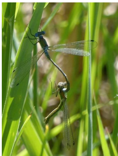
páříci se šídlatky tmavé

Děk za finanční podporu managementu na Jívce patří Nadačnímu fondu Veolia.