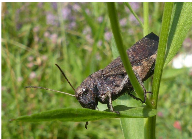
Dva vzácní obyvatelé Hraniček – hnědásek květelový a saranče vrzavá

Tyto i další fotografie v tiskové kvalitě ke stažení na http://www.csop.cz/kestazeni/foto_hranicky.zip