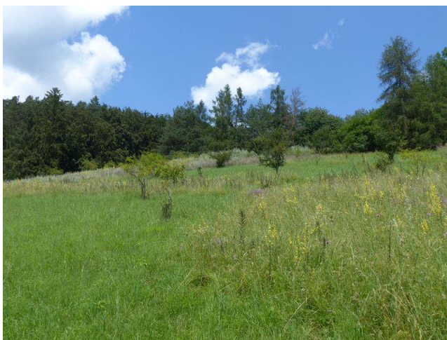
Místo pro přírodu Hraničky