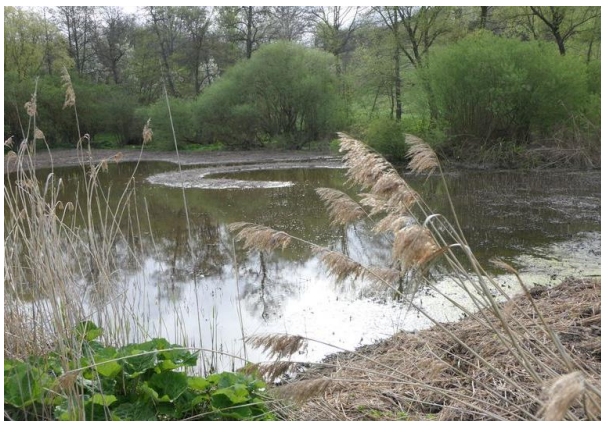
Nad Hájkovým rybníkem